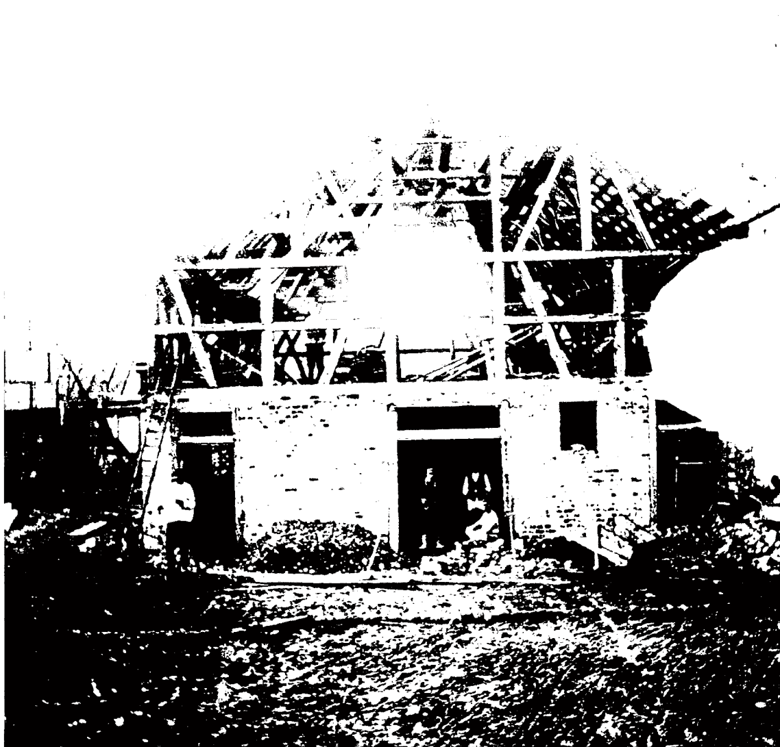
Schweizer Kolonisten beim Bau eines Hauses in Nova Lava.