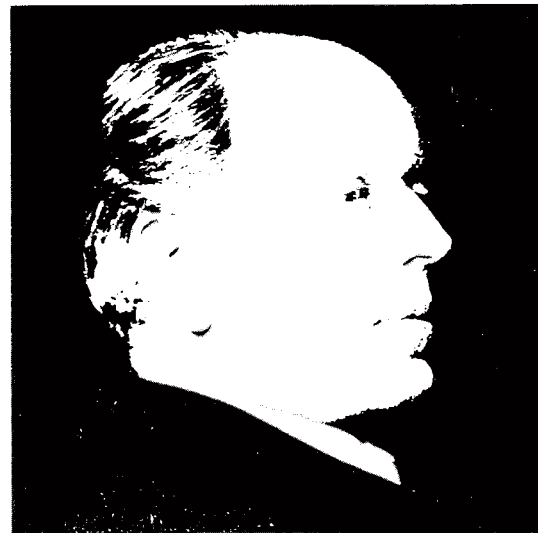
Der Schweizer Kommunistenführer, Nationalrat und Initiator der Schweizer Genossenschaftsgründungen in der Sowjetunion Fritz Platten (1883–1942) um 1934.

Im März 1921 gehörte Platten trotz anfänglicher Bedenken, da er um die Einheit der Partei fürchtete, zum linken SPS-Flügel, der zusammen mit den Altkommunisten die KPS gründete.