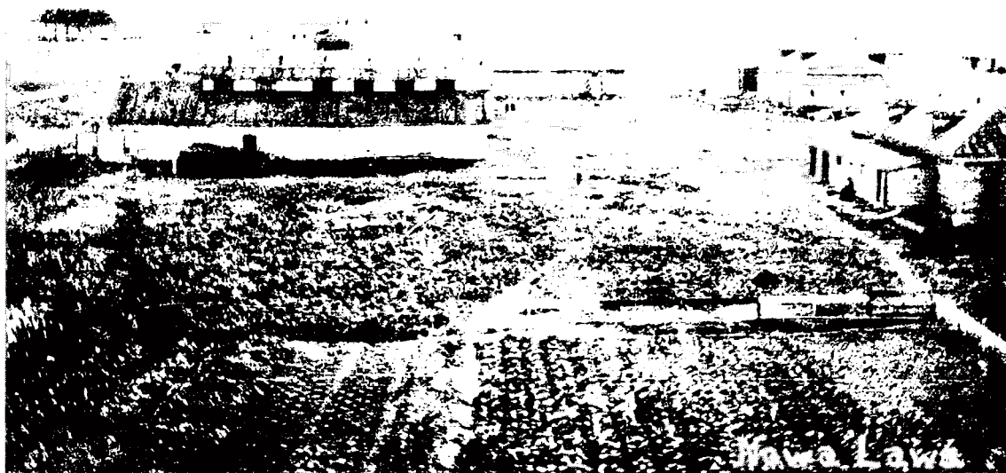
Teilansicht des Gutes Nova Lava

Vor der Revolution war das Gut Teil eines 12 000 Desjatinen Ackerland umfassenden landwirtschaftlichen Grossbetriebes gewesen, der einer Gräfin Katovka gehört hatte. 95 Prozent davon waren nach der Revolution an die Bauern verteilt worden; der Rest lag eine Zeitlang brach, bis daraus eine Sowchose gebildet wurde, die jedoch mangels Kapital «nicht funktionierte». Deshalb wurde er dann den Schweizer Immigranten angeboten.